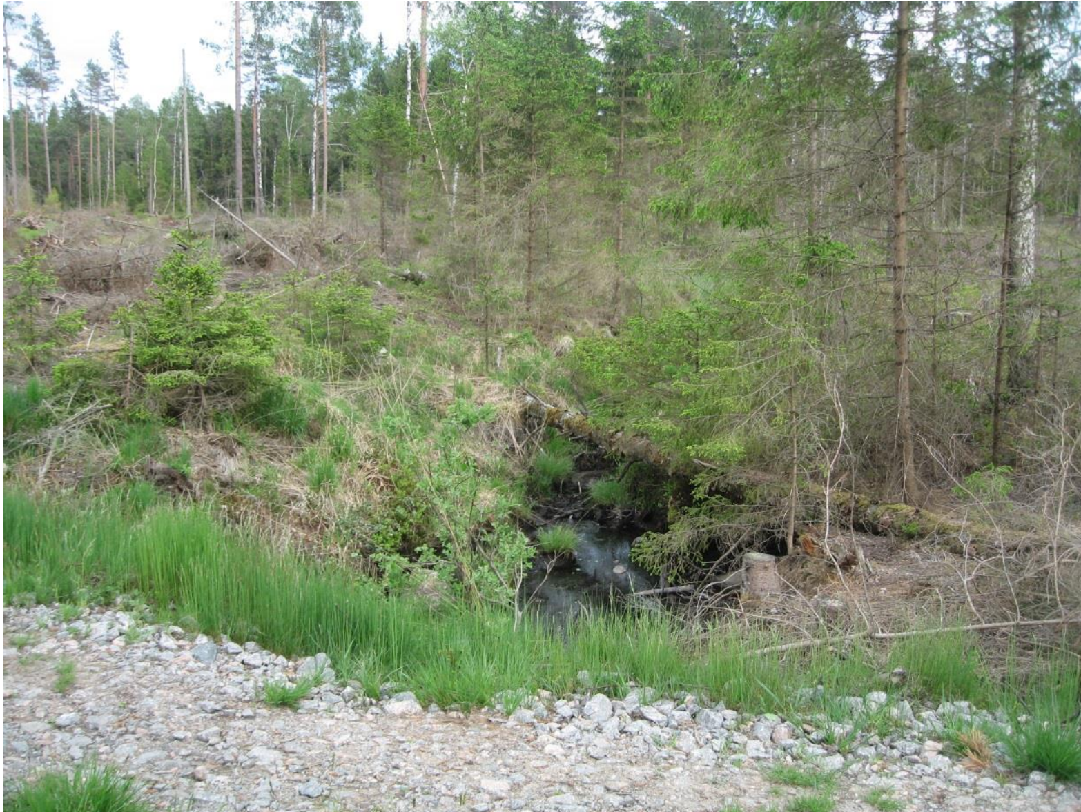
Foto 1 Befintlig skogsväg korsar mindre bäck inom våtmark klass 2.