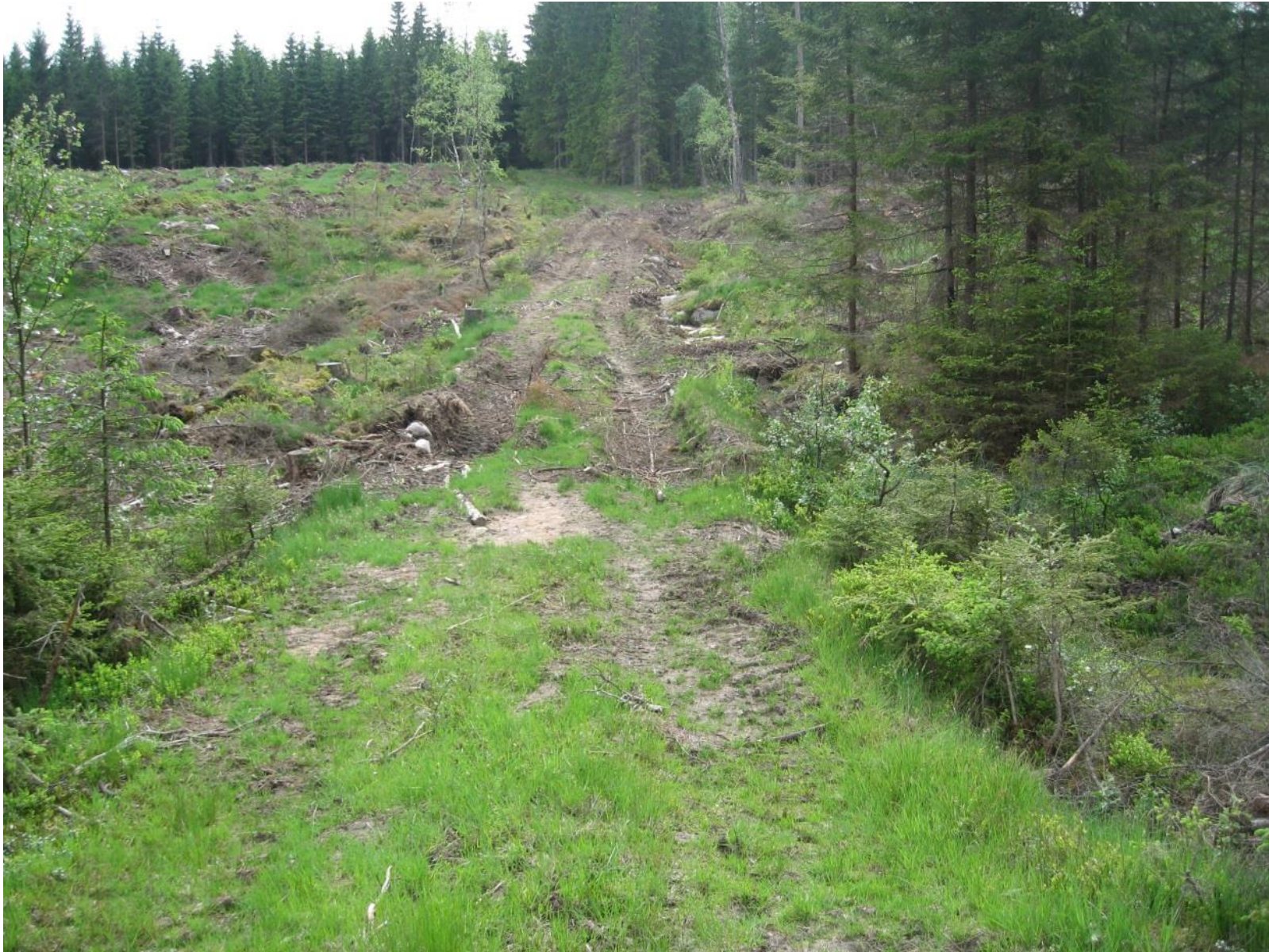
Foto 2 Befintlig traktorväg korsar våtmark klass 2 i svackan.