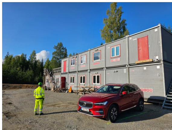
Platskontoret för vindkraftpark Bruzaholm.