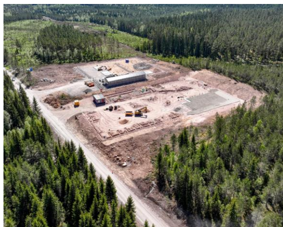
Arbetet med grundläggningen för batterilagret samt E.ONs transformatorstation är snart färdigställt.