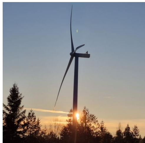
Vindkraftverk i Grönhult vindkraftspark.