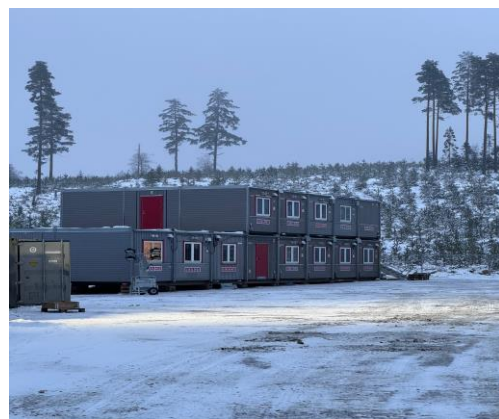
Platskontoret för Velinga vindkraftpark