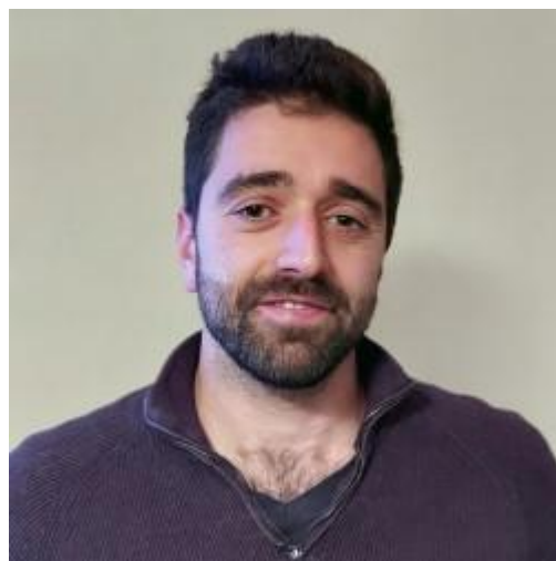
Projektledare Johan Matini.

Tidaholm verkar vara ett charmigt samhälle. Med sina unika drag och vänliga atmosfär ger det ett intryck av en plats med karaktär och gemenskap.