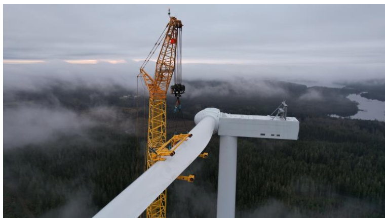
Byggnation av Grönhult Vindkraftpark

Vänliga hälsningar, Projektteamet för Velinga vindkraftpark